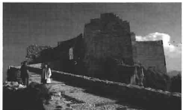
Castillo de Montesa

En el Museo de San Pío V, he tenido la ocasión de realizar la intervención más satisfactoria y dificultosa, en cuanto a los trabajos de patrimonio, no en balde me ha supuesto trece años hasta conseguirlo. Se trata del remontaje de un bellissimo patio renacentista italiano de tres plantas, pienso que único en el mundo, por sus proporciones, materiales y riqueza en la labra de sus sillares de mármol de Carrara. Sus piezas se encontraban dispersas desde 1.859, aunque la mayor parte de sus columnas y arquerías estaban impostadas en el Convento del Carmen de Valencia y sus ventanales en el Museo de S. Pío V. Hubo que desmontar centenares de piezas, restaurarlas y tras estudiar sus posiciones primigenias, recons-