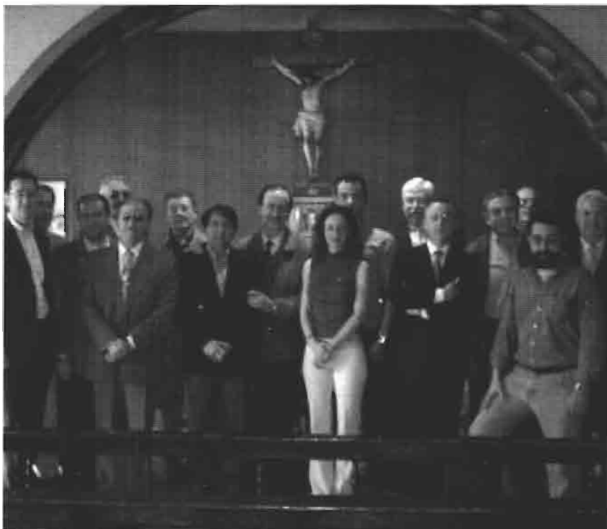
Celebración del Día del exalumno del 2007