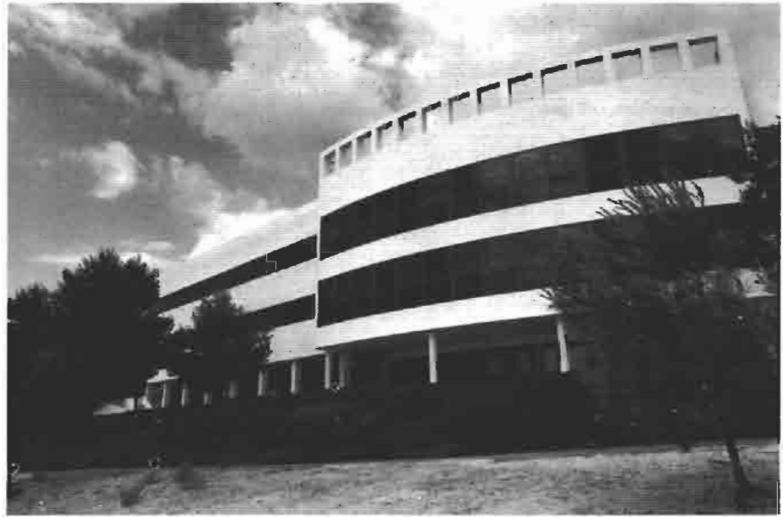
Residencia para la Tercera Edad en Benidorm

Es Máster en Técnicas de Intervención en el Patrimonio Arquitectónico por la universidad Politécnica de Valencia, Arquitecto Conservador del Monasterio de Santa María de La Valldigna por la Generalitat Valenciana y Arquitecto Conservador de la Catedral de Valencia.