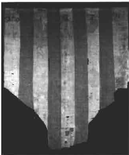
Pendón de Jaime I

La lectura de los acontecimientos en torno a la venida al mundo de nuestro querido monarca el rey Jaime I, siempre me planteó la duda de si era, o no, el primer relato en su género entre los de probada documentación histórica. Pues, conocidos por eruditos e historiadores y desconocidos por la mayoría, los pormenores de su nacimiento, caso de ser afirmativa mi suposición, podrían haber lanzado al rosellonés y más antiguo historiador de la corona de Aragón, Bernat Desclot, autor de la crónica, a interponer demanda por plagio o, como poco, a denunciar de escasa originalidad al genial pintor a pluma y renovador del lenguaje novelesco, Giovanni Boccaccio, por el parecido con alguna de sus pintorescas tramas; O haber tildado de nada imaginativa a Celestina, profesional del arreglo amatorio a quien su autor y maestro del diálogo, Fernando de Rojas, haría intentar las más variadas