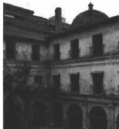
Claustro del Monasterio

Uno de los últimos destinos que se han planteado para este deteriorado convento es convertirlo en "Centro Sorolla". Si el proyecto se lleva a cabo, San Vicente de la Roqueta tendrá un uso cultural, ya que los anteriores intentos de dotarlo como museo religioso, Hemeroteca Municipal, Tribunal Internacional del Agua o sede de la Academia Valenciana de la Lengua nunca llegaron a materializarse. Hay colectivos vicentinos que promueven la re-