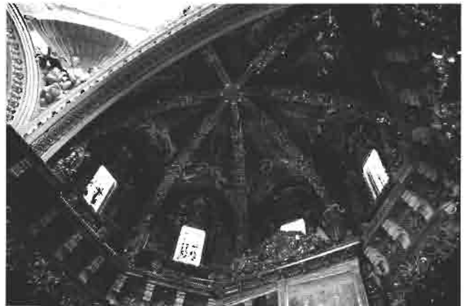
Frescos de la cúpula de la Catedral de Valencia