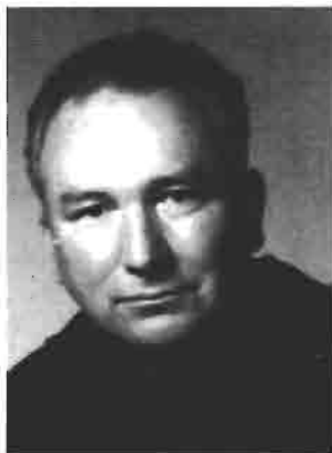
(1916 Villamantero- Entrerriós (Argentina) -1999 Valencia)