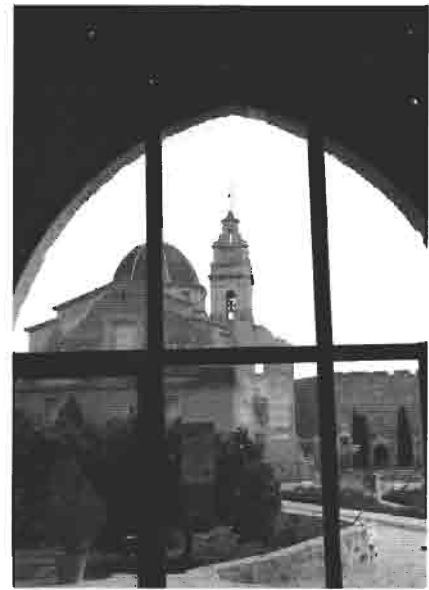
Monasterio Sta. María de la Valldigna

En los últimos diez años he estado trabajando también en la restauración de la Cartuja de Ara Christi de El Puig. Es una construcción renacentista del siglo XVI que ocupa una superficie de casi cien mil metros cua-