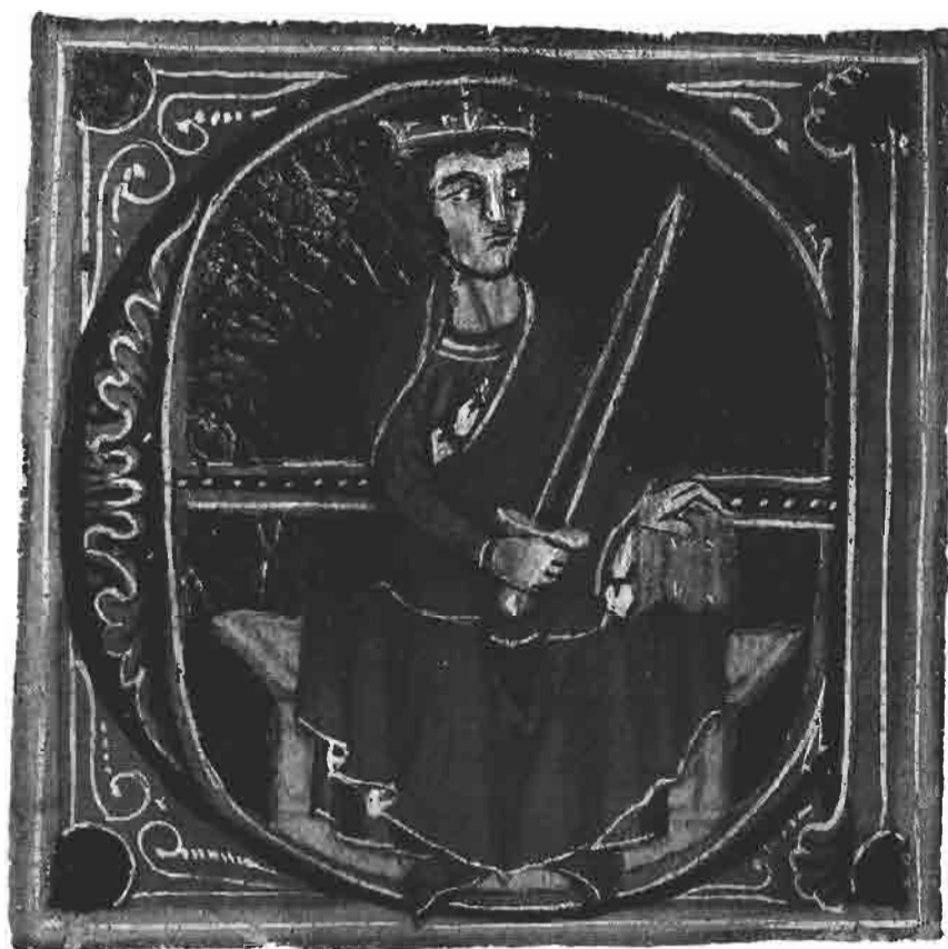
Miniatura del Llibre dels Furs

el rey. Y allá van. Su fino olfato de cazador no le da aviso del cambio, -quizá por desconocer la pieza-. Quedan velando en la antesala del aposento, dos notarios, doce cónsules, diez caballeros y ciudadanos de pro, doce dueñas de las más honradas de la comarca y hasta el oficial del obispo con cuatro canónigos y cuatro buenos religiosos. -¡Vaya con el secreto!-. Serán los testigos de la Reina María. Al amanecer abrirán las puertas de la cámara y, desvelando el engaño, según el cronista, “dejarán maravillado al rey”... -¡¡Seguro que así fue!!-.