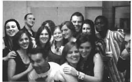
La autora con los compañeros del curso

Cambridge en vez de a Londres porque Londres es tan cara y grande que asusta. En cambio, las ventajas de Cambridge es que podía ir a todos los sitios en bici (Cambridge es la ciudad con más bicis de toda Inglaterra) y a pesar de ser una ciudad pequeña tenía todo lo necesario para un estudiante, y si alguna vez había algo muy especial que hacer en Londres tan sólo tenía que coger un tren que tardaba 45 minutos (aunque eso sí, carísimo). Yo decidí vivir en una residencia para conocer a más gente, y la decisión fue la acer-