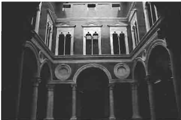
Patio del Embajador Vich. Museo S. Pío V. Valencia.

nasterio de Santa María de La Valldigna, sin duda marcan mi trayectoria profesional, ya que, al menos en el tiempo, veinticuatro años al frente de la actuación, se puede decir sin temor a equivocarse, que ha sido donde, y sigue siendo, la obra de mayor dedicación. Resumir aquí la gran cantidad de actuaciones es prácticamente imposible. Prefiero transmitir telegráficamente mis sensaciones al respecto. En el año 1,984 casi estaba profesionalmente empezando a conocer lo que era el patrimonio. Me encontré con los restos de un