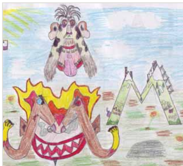
Dibujo de Aurora Barberá

A todos, feliz verano y mucha fortuna en la nueva andadura.