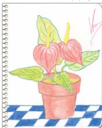
Paula Carbonell. 5° A